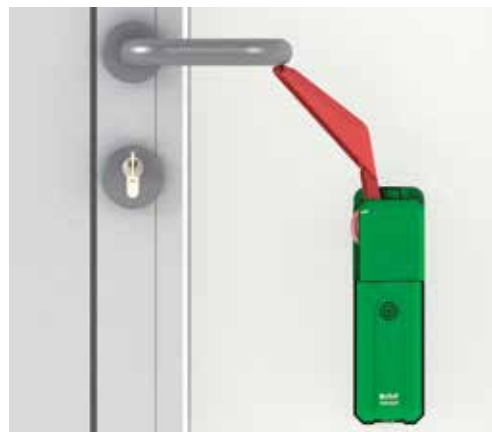
Montage sur porte pleine