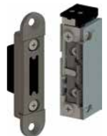
Set ohne Schließblech Für die flexible Verwendung mit ProFix®2 Schließ- blechen der Marke effeff. Türöffner mit Rückmelde- kontakt und Schutzdiode.