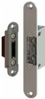
Komplett-Set mit Schließblech (160x24x3mm) Türöffner mit Schutzdiode.