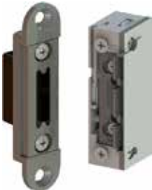
Set ohne Schließblech Für die flexible Verwendung mit ProFix®2 Schließ- blechen der Marke effeff. Türöffner mit Schutzdiode