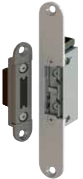
Komplett-Set mit Schließblech (160x24x3mm) Türöffner mit Rückmeldekontakt und Schutzdiode.