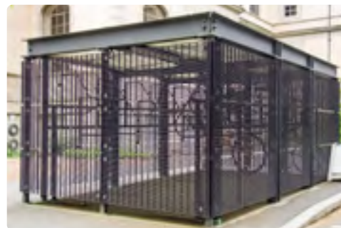
Portails et containers extérieurs