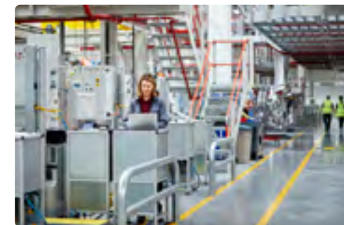
Machines et panneaux de commande