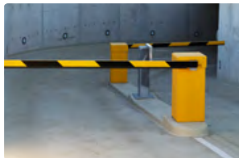
Barrières de parking