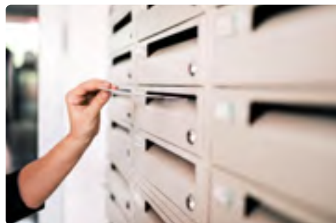
Boîtes aux lettres