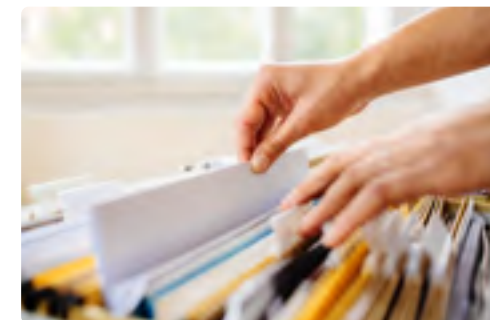
Armoires et casiers